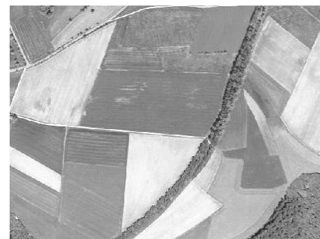
Zwischen Roszbach und Weißenbach liegt ein langgestrecktes Gebüsch. Wieso ist das so lang und was verbirgt sich darunter?

Strecke 46 ist eine Autobahnruine in Deutschland, die zwischen Fulda und Würzburg parallel zur heutigen A7 verläuft. Der Bau dieser Autobahn wurde 1937 begonnen und 1939 eingestellt. Grund hierfür waren der Abzug von Arbeitskräften und Materialien zu Kriegszwecken. Auch die Einführung neuer Normen im Autobahnbau nach Beginn der Bauarbeiten erschwerten