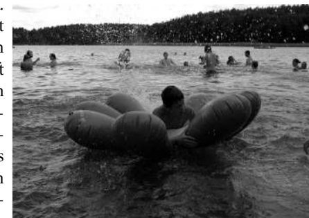
Badespaß in Großzerlang

Schilf und Metallbolzen befreit. Und das Ergebnis am Samstag konnte sich sehen lassen. Neben der Arbeit kam natürlich auch der Spaß nicht zu kurz. So feierten wir zwei Geburtstage, bauten ein Floß und fuhren Kanu auf der Mecklenburgischen